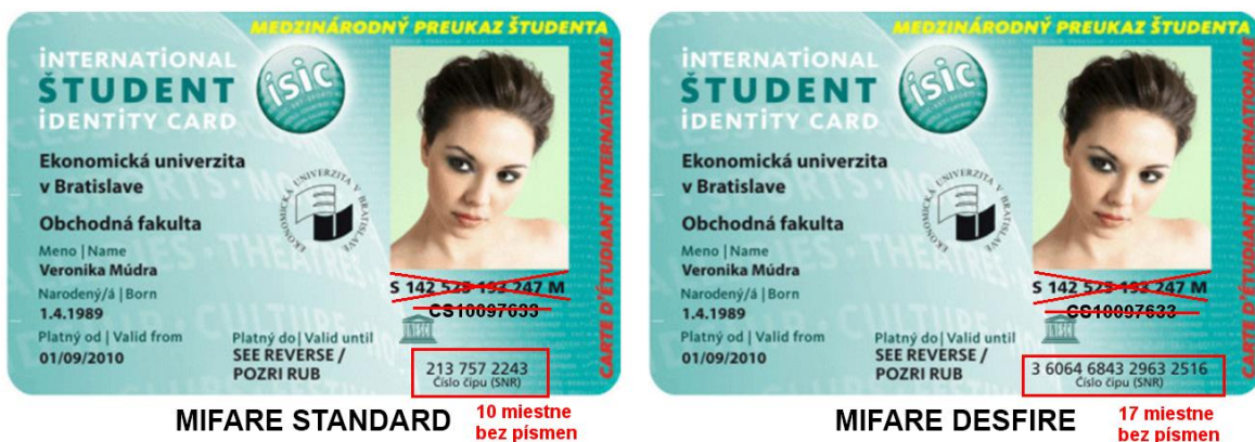
Fig. A ISIC number